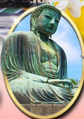
พระใหญ่คามาคุระ