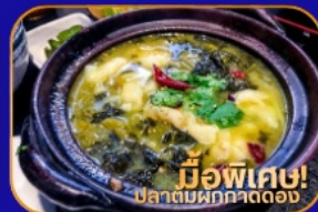
มีอพิเศษ! ปลาต้มผักกาดดอง