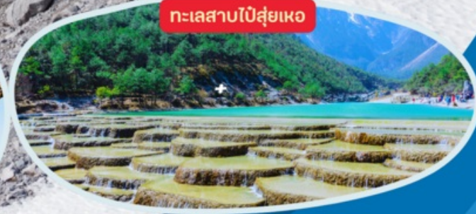
ทะเลสาบไป๋ส่วยเหอ