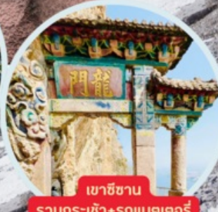
เขาสีซาน รวมกระเช้า+รถแคบเตอร์