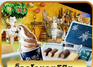
ช็อกโกแลตชิช: