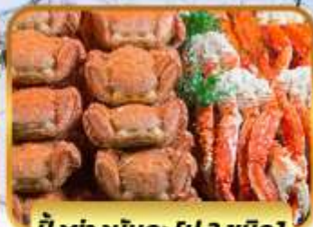
บ๊ิงย่างนัต: [ปู 3 ชนิด]