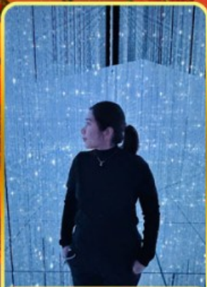
ทีมแอลโตเกียว