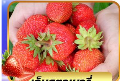
เก็บสตอเบอร์รี่