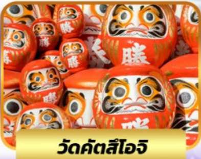
วัดคัตสึโงะ