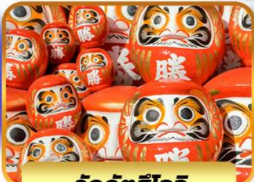
วัดคิตสึโอจิ