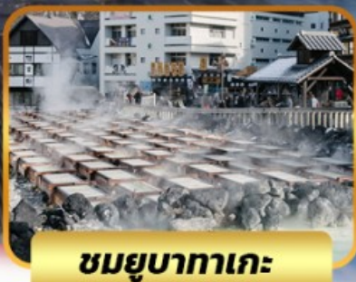
ชมยูบาทาเกะ