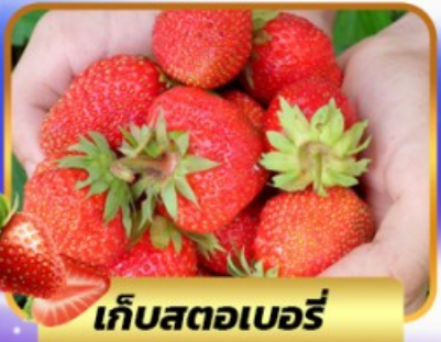
เก็บสตอเบอร์รี่