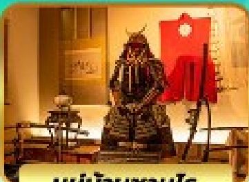
หมู่บ้านซามูไร