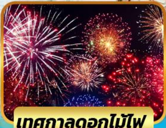
เทศกาลดอกไม้ไฟ