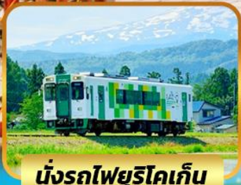
นั่งรถไฟยูริโคเกิน