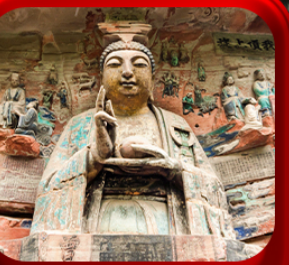
“ ผาหินแกะสลักต้าจู่ ”

บินตรงลงฉงชิ่ง • อุ๋หลง หลุมฟ้าสะพานสวรรค์ • ระเบียงแกว • อุทยานเขานางฟ้า หงหยาดัง • นั่งรถไฟทะเลสาบ • ศาลาประชาม (ด้านนอก) • หลงหมินฮ่าว มรดกโลกผาหินแกะสลักต้าจู่ • วัดหลิวฮั่น • ตึกตะเกียบ • หมู่บ้านโบราณสี่ซีโหว่