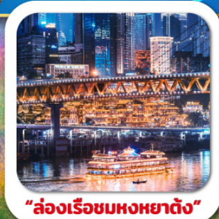
"ล่องเรือชมหงหยาดัง"