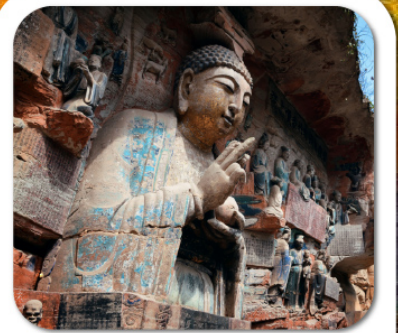
"พาสินแกะสลักต้าจู่"