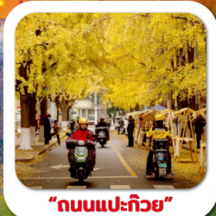
"ถนนแปะก๊วย"