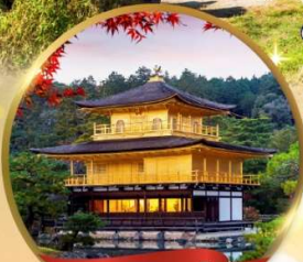
วัดทองคินคะคุจิ