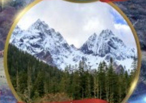
ภูเขาสี่ฤดู