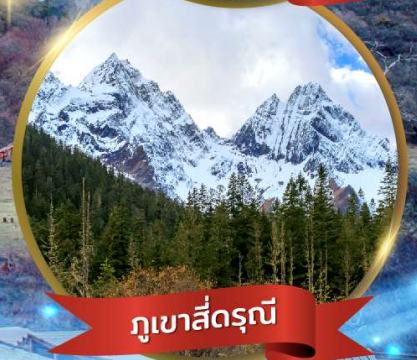
ภูเขาสีดรุณี