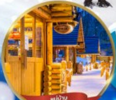
หมู่บ้าน NINGLE TERRACE

สนุกสนาน ณ ลานสกี • หมู่บ้านราเมนอาซาฮิคาว่า • หมู่บ้านนิงเกิลเทอเรส ขบวนพาเหรดเพนกวิน ณ สวนสัตว์อาซาฮิคาว่า • โรงงานช็อกโกแลต โอดารุ • ศาลเจ้าฮอกไกโด • พระใหญ่ HILL OF BUDDHA