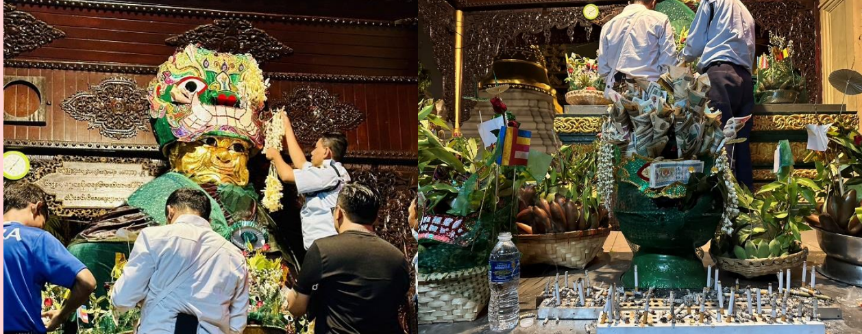
วิธีการขอพรจากแม่ยักษ์

พาท่านเดินไปขอพรที่ แม่ยักษ์ ผู้ปกป้องดูแลเจดีย์ คนพม่าเชื่อว่าแม่ยักษ์... จะช่วยในการตัดกรรมจากเจ้ากรรมนายเวร โดยเฉพาะอย่างยิ่งผู้ที่มีเวรกรรมกับเจ้ากรรมนายเวรทั้งหลายช่วยขจัดเคราะห์กรรม ขจัดอุปสรรค ติดขัดต่างๆ ความสำเร็จอธิษฐานขอให้ท่านช่วย ให้ชีวิตของคุณมีแต่ดีขึ้นเรื่อยๆ ซึ่งถ้าหากคุณกำลังมีทุกข์และหาหนทางไม่ออก ก็ลองมาไหว้ขอพรแม่ยักษ์ให้ช่วยบันดาลให้สิ่งร้ายๆ สิ่งไม่ดี ออกไปจากชีวิต และขอให้ชีวิตมีแต่สิ่งดีๆ เข้ามา นอกจากนี้ยังเชื่อกันว่าแม่ยักษ์...ยังช่วยเรื่องความมีชื่อเสียงโด่งดัง เป็นที่รู้จักก้าวหน้าในหน้าที่การงาน ใครที่ตกงานอยู่ จุดนี้เป็นอีกหนึ่งจุดที่ต้องห้ามพลาด ปล.แม่ยักษ์จะประดิษฐานอยู่ติดกับบันไดประตูทางทิศตะวันออกค่ะ