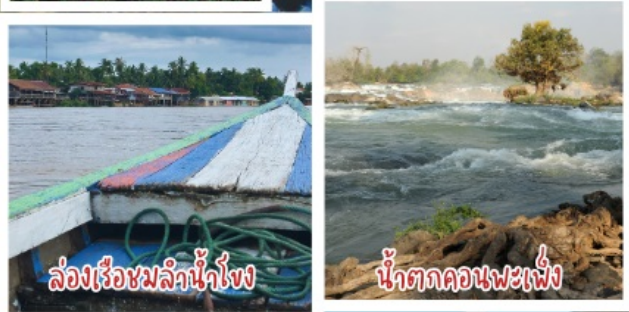
ล่องเรือชมลำน้ำโขง