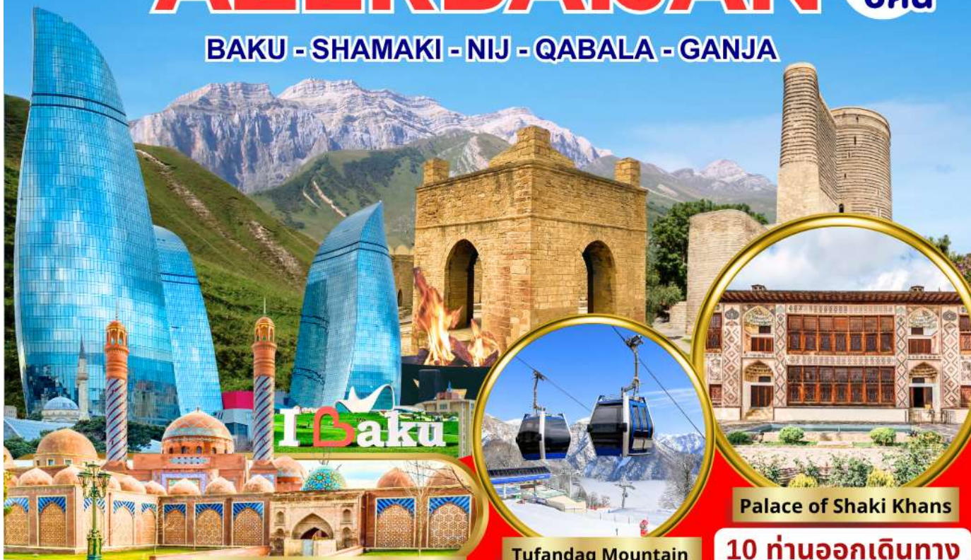
Masjid Imamzadeh Ibrahim