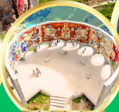
Russian-Georgian Friendship Monument