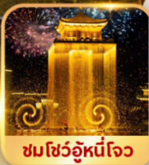
ชมโชว์อุหนี่โจว