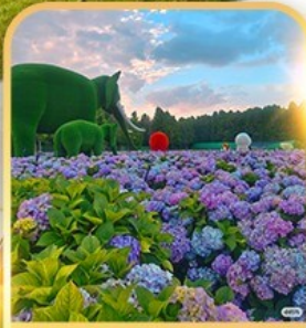
ดอกไม้ตามฤดูทง