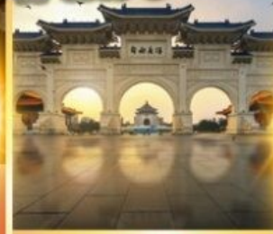
อนุสรณ์เจียงโตเซก