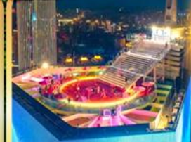
จุดชมวิวจางชิ่งเวิลด์เทรด 131