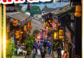
หมู่บ้านโบราณเฉิงชือโจว