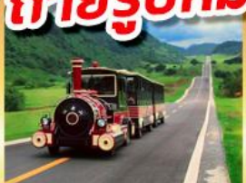
อุทยานนางฟ้า