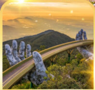
สะพานมือยักษ์