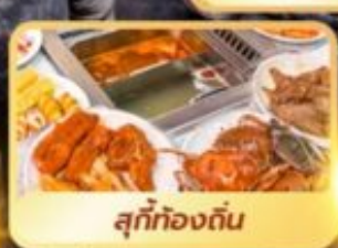
สุกี้ท้องถิ่น