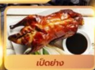
เป็ดย่าง