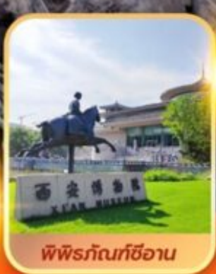
พิพิธภัณฑสถานซีอาน