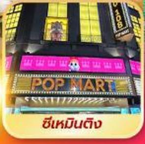
ซีเหมินติง