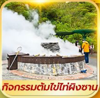
กิจกรรมต้มไข่ไท่ผิงซาน