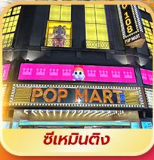
ซีเหมินติง