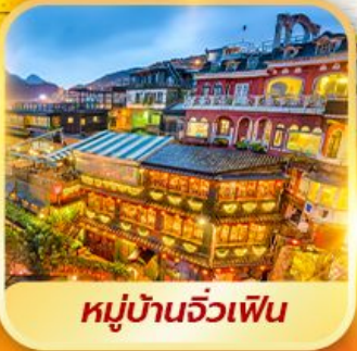
หมู่บ้านจิวเฟิน