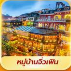
หมู่บ้านจิวเฟิน