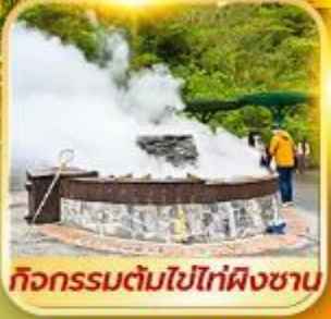
กิจกรรมต้มไข่ไท่ผิงซาน