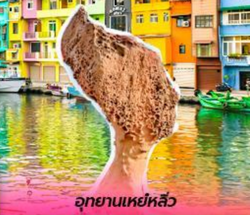
อุทยานเหย์หลิว