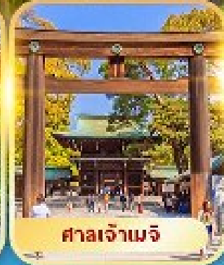
ศาลเจ้าเมจิ