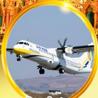
บินภายใน 1 ชม