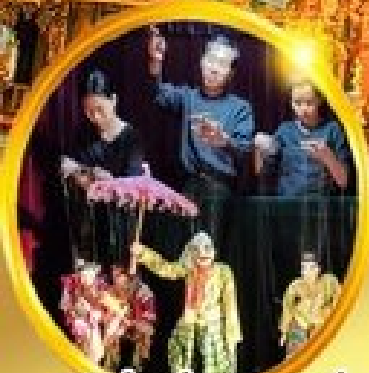
ชมโชว์เชิดหุ่นกระบอกพม่า

ย่างกุ้ง ทงสาวดี พระธาตุนครอินทร์แขวน พุกาม มัทนทะเลย์ 5วัน 4คืน