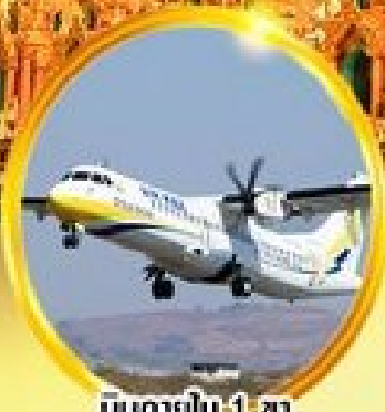
บินภายใน 1 ชม