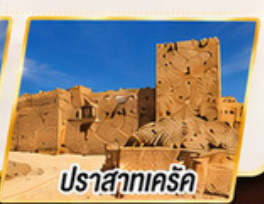
ปราสาทเคิร์ค