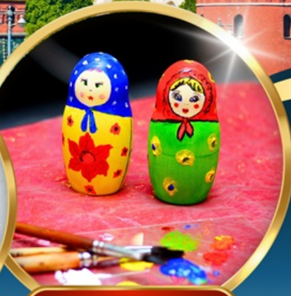
• MATRYOSHKA PAINTING •

🏠 น้ำหนักกระเป๋า 30 กิโล 🛡️ รวมประกันการเดินทาง 🏨 พักโรงแรม 4 ดาว 🍴 อาหาร 15 มื้อ