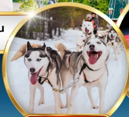
• SAAMI VILLAGE •