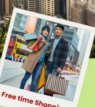
Free time Shopping