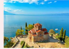
St. John at Kaneo Church ป้อมปราการซามูเอล