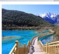
ไป๋สุ่ยเหอ