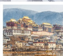
วัดลามะชงจันหลิน