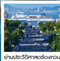
ย่านประวัติศาสตร์ตงกวน

Fisherman's Wharf • จัตุรัสชิงไห่ (รวมรถราง) • ถนนตงกวน • เวนิสแห่งต้าเหลียน • ถนนรัสเซีย