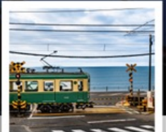
รถไฟเอโนะเดิน