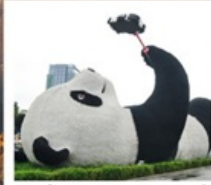
รูปปั้นหมีแพนด้าชงชี่