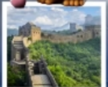
กำแพงเมืองจีนด่านซือหม่าโต

เมืองโบราณกู่เป่ย์ซู่เจิ้น / กำแพงเมืองจีนด่านซือหม่าโต (รวมค่ากระเช้าขึ้น-ลง) / ชมวิวกำแพงเมืองจีนและเมืองโบราณ ยูนิเวอร์แซลปักกิ่ง (รวมค่าบัตรเข้า) / จตุรัสเทียนอันเหมิน / พระราชวังโบราณฤดูร้อน / หอบูชาเทียนถาน คาเฟ่ทาฟังกาเป่ย์ฟานน้ำเต้า (TANG FANG CAFE) / พระราชวังฤดูร้อนอวิ๋เหอหยวน / ย่านชานหลี่ถุน (POP MART) / ถนนคนเดินไท่กุ่หลี่