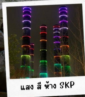
แสง สี ห้าง SKP