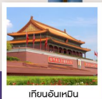
เทียนอันเหมิน