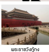
พระราชวังกู้กง