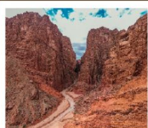
แกรนด์แคนยอนเทียนชาน