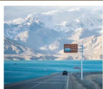
ทะเลสาบไ้ซาหู่