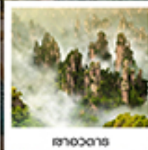
ฉางอวตาร