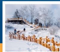
เขาเกาะหลู่