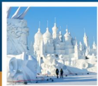
เกาะพระอาทิตย์