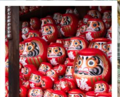
วัดคัตสึโอจิ