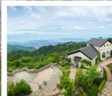
สทโกะ การ์เด็น เทอร์เรซ