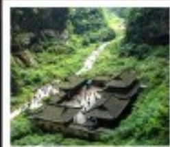
หลุมฟ้า สะพานสวรรค์

พระพุทธรูปแกะสลักหิน / หมู่บ้านโบราณเมืองฉีเป่ียว อุทยานหลุมฝังศพพันสวรรค์ / สะพานมังกร / อุทยานนกนางพิน ภูเขาโมโก / Wulong Flying Kiss / เข็มปักถนนคนเดินเซี่ยฟางเป่ียว เข็มปักหงหยาดัง / มหาศาลประชาชน / เมืองไฟฟ้าทะเลตึก ถนนโบราณจีนแท้ / ศูนย์หมีแพนด้า