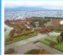
โทริยิวกะกุ ทาวเวอร์

หุบเขานรกจิโระคุดาบ / โทดองฮังของคานโมริ ตลาดเช้าเมืองฮาโกดาเตะ / โทริยิวกะกุ ทาวเวอร์ ภูเขาไฟอุสุ / จุดชมวิวยูซึก / ค่องเรือชมทะเลสาบโทบะ สวนอุซึมิโตะ / สวนพฤกษศาสตร์ / เก็บผลไม้ / สัมผัสน้ำพุร้อน พิพิธภัณฑ์คองดงดริ / ภาวนิภาอินน้ำโบราณ / โรงเบียร์แก้วคิตาฮิชิ เนินพระพุทธรเจ้า / ถนนฮิโอบังทาบูกิโกจิ / ย่านซูซุกิโนะ