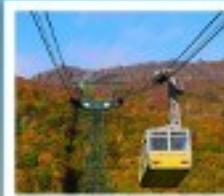
ภูเขาไฟอุสุ