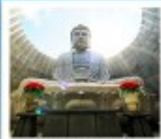
เนินพระพุทธรเจ้า