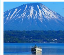
ค่องเรือทะเลสาบโทเยะ