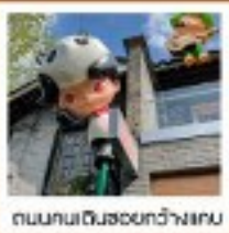
ถนนคนเดินฮวงหลง