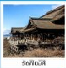
วัดคิโนมิชิ