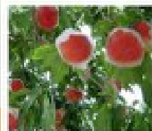
เก็บสุกฉิม