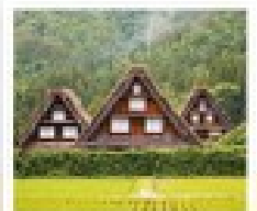
ชิราคาวาโกะ