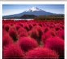
สวนโอะฮิชิ ป่ารัก

วัดเมียวโตะจิน / ถนนเมียวโตะจิน โฮโมเตะชินโด / พิพิธภัณฑ์ชิราคาวาโกะ / ซินมาชิ ซูจิ / คามิโกจิ / สะพานกินปะ / สวนโอะฮิชิ ป่ารัก / ทุ่งดอกไม้เบเนดิก / โอชิโนะ ฮัทสึ / สวนโอะวะคิเนน / วัดอาซากุสะ / ตลาดปลาซึกิจิ / ฮิโระบิชิฮิมะ / มิโดซุมิ เฮอท์เล็ท พาร์ค คิซารุชิ