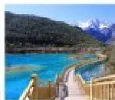
น้ำพุร้อน