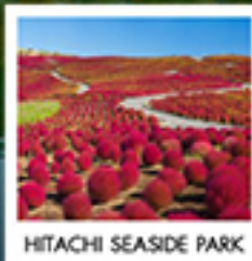
HITACHI SEASIDE PARK