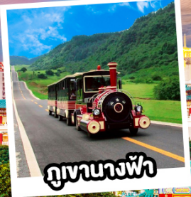
ภูเขาฉางฟ้า